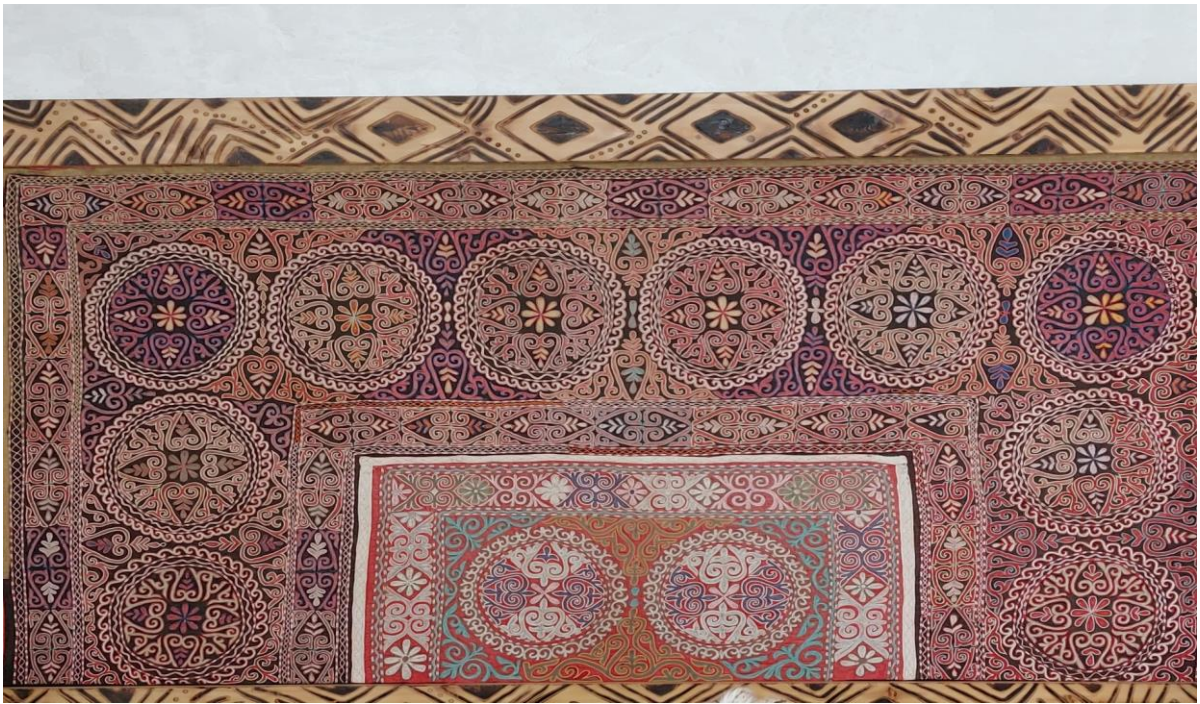
Тускииз – вышитый настенный ковер рода кереев