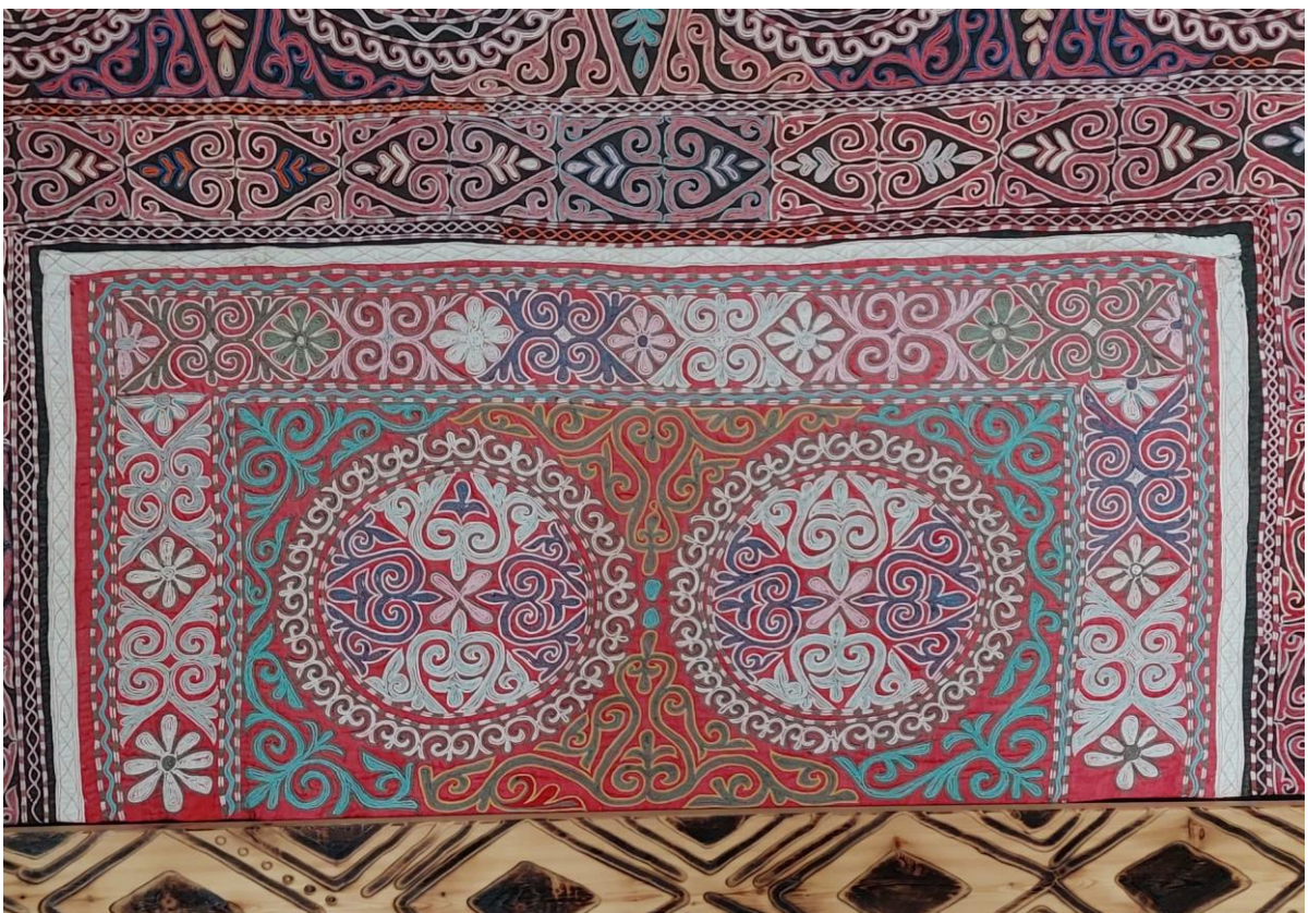
Внутренняя часть верхнего тускииза