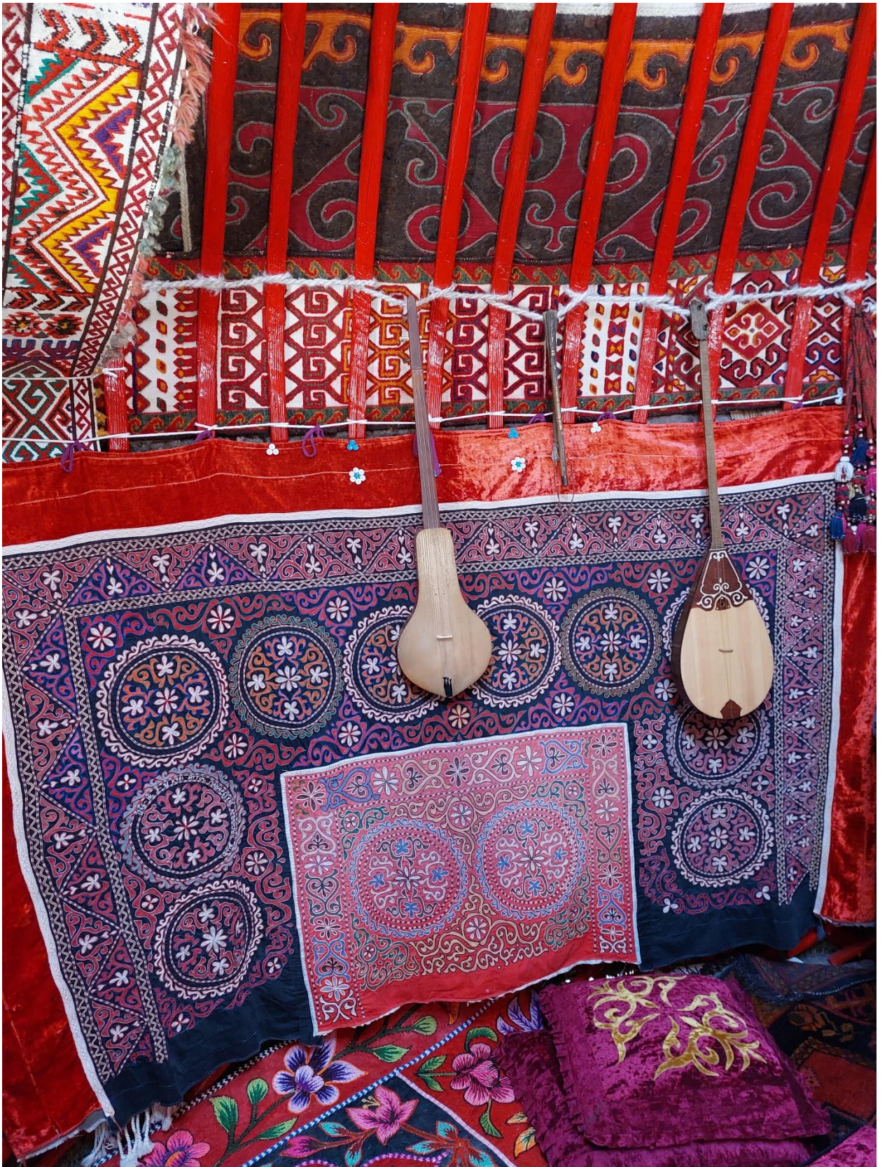
Түскииз казахов из Монголии рода Керей, акбаскур, домра и шертер