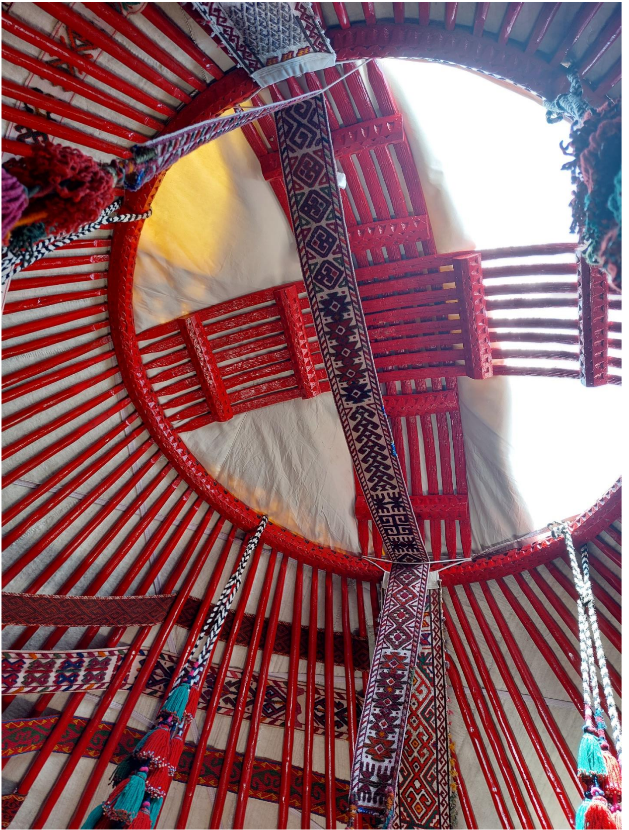
Шанырак с акбаскурами