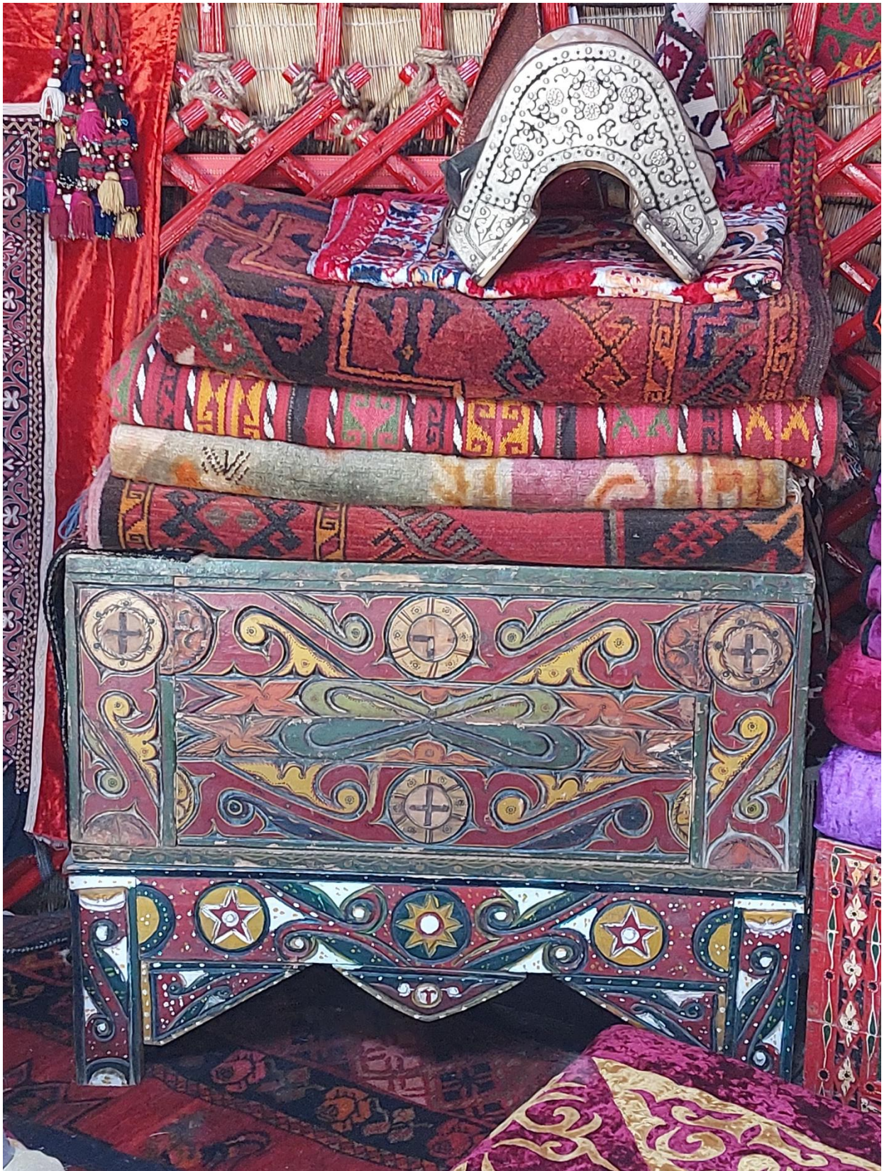
Сундук резной на ножках – жук аяк с мотивом в виде круглого часового циферблата. На подставке изображены пятиконечные звезды. Поверх стопки ковровых изделий лежит седло, инкрустированное посеребренным металлом.