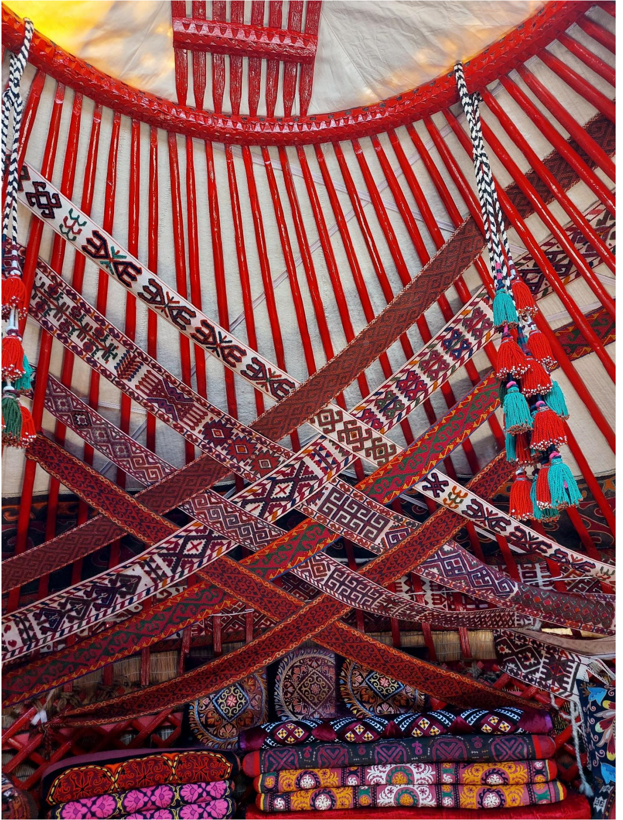
Оформление юрты акбасурами и баскурами