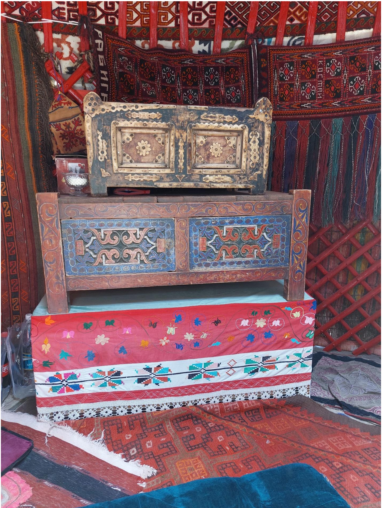
Сундук инкрустированный костью (верхний), кебеже резной (посередине) и покрытый вышитым крестиком чехлом- сундык кап – сундук (внизу)