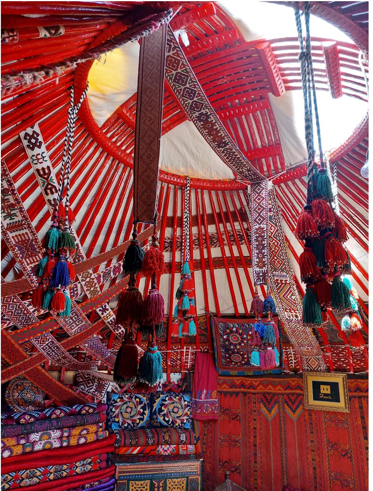
С шанырака спускаются шашакбау