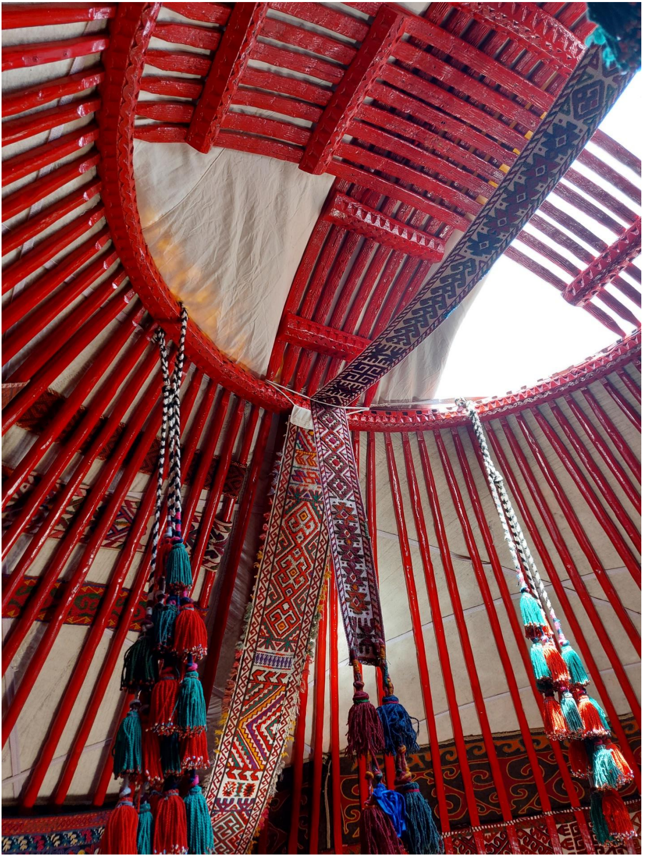
С шаныраки свисают шашаки – декоративные кисти-обереги